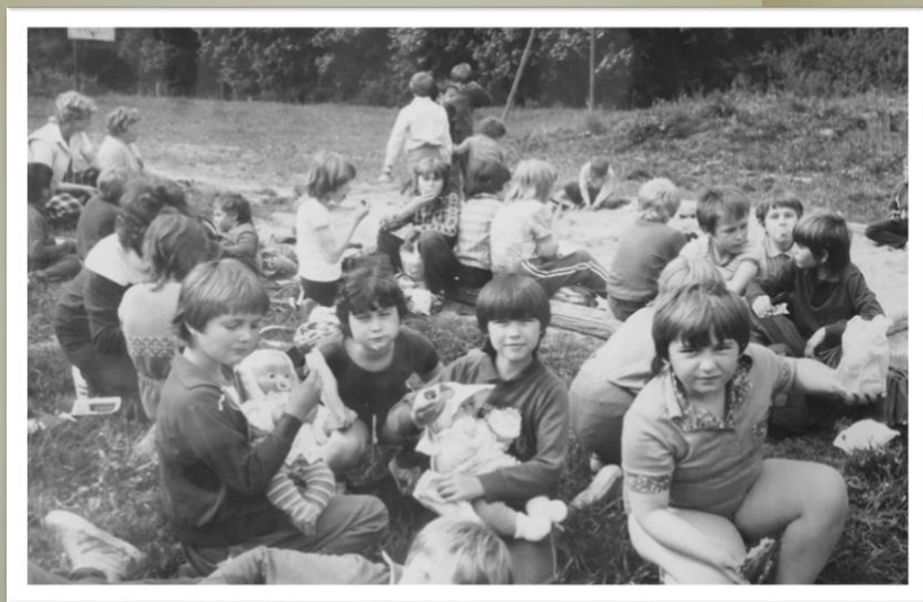
Obr. 2 ŠVP 1983

Uvolněná atmosféra šedesátých let si razila cestu do nebušické školy poměrně obtížně, ale přesto se můžeme i zde setkat se známkami jistého mírného uvolnění. Začalo se např. experimentovat s tzv. vnitřní diferenciací. Nebušická škola patřila ke školám, které zavedly