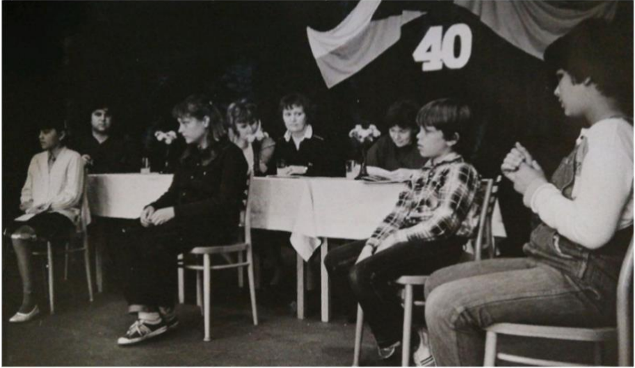
Soutěž o zemi 1985

věnovat se i žákům, kteří nemají dispozice k vyššímu vzdělání. Na tyto hlasy však nebyl brán zřetel.