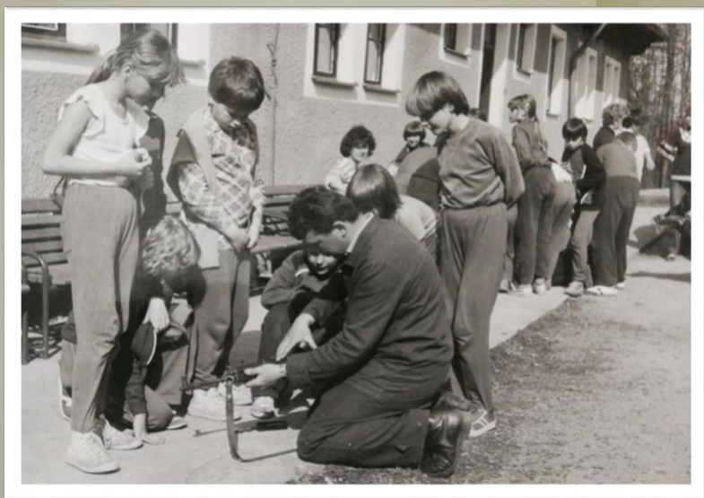
Obr. 1 branný běh

být zřizovány triviální školy 1 pro děti ve věku od 6 do 12 let v sídlech farností. Nebušice spadaly pod libockou farnost, proto měly nebušické děti docházet do Liboce. Cesta do školy byla pro děti obtížná a namáhavá a dá se předpokládat, že tam zdaleka ne všechny pravidelně chodily (Tereziánský školní řád rodičům navzdory obecně rozšířené představě povinnost posílat děti do školy striktně neukládal a v letních měsících musely děti pomáhat v hospodářství). Není proto divu, že se ve starých